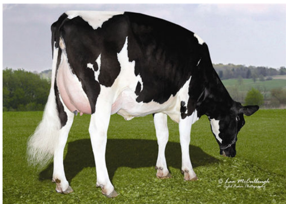
HONEYCREST SHOTTLE FAITH FOURTH DAM